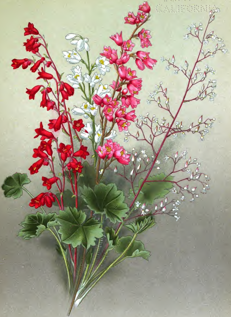
Heuchera sanguinea Engelm., H. rosea Zabel et var. alba , H. rubescens Torr.

Геухера багряная, Г. розовая и белая, Г. красноватая.